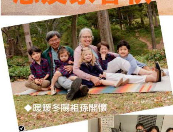
◆ 暖暖冬陽祖孫開懷