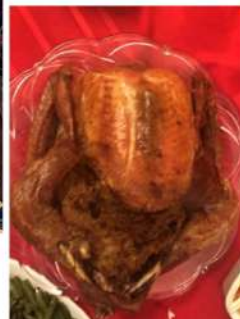
◆ 20年後 我與丈夫再烤制 火雞大餐