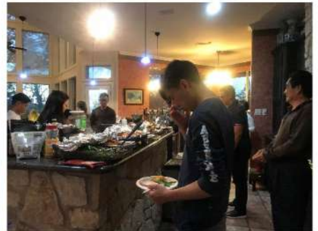
◆ 居家感恩的教會青年