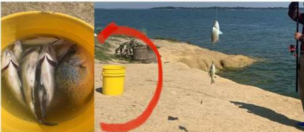
◆ 疫情不能阻止魚咬魚鈎