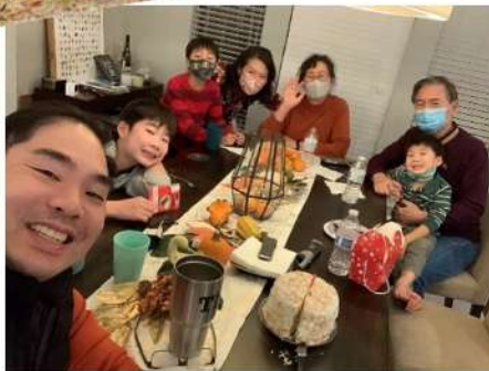
◆ 別來無恙 三代同堂