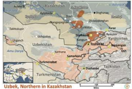
Uzbek, Northern in Kazakhstan